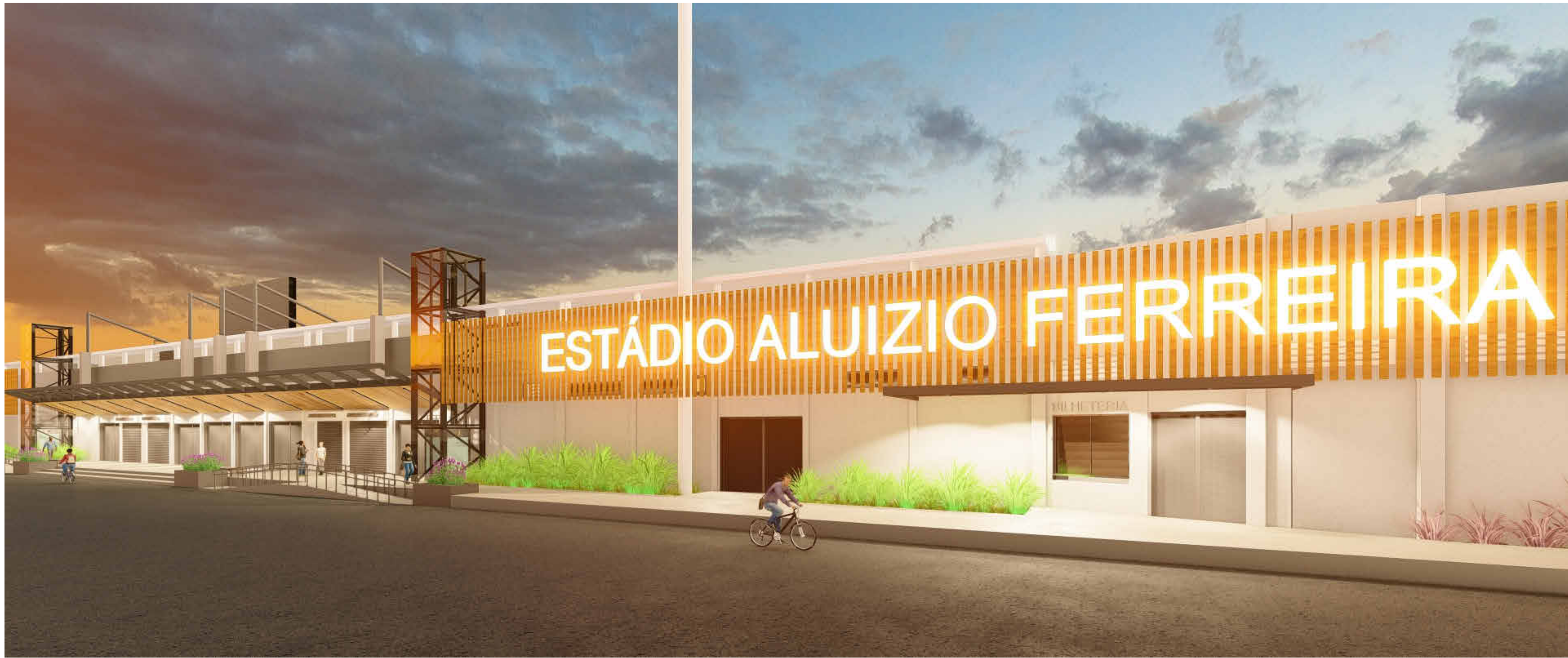
IMAGEM 1 - ACESSO SETOR A/B