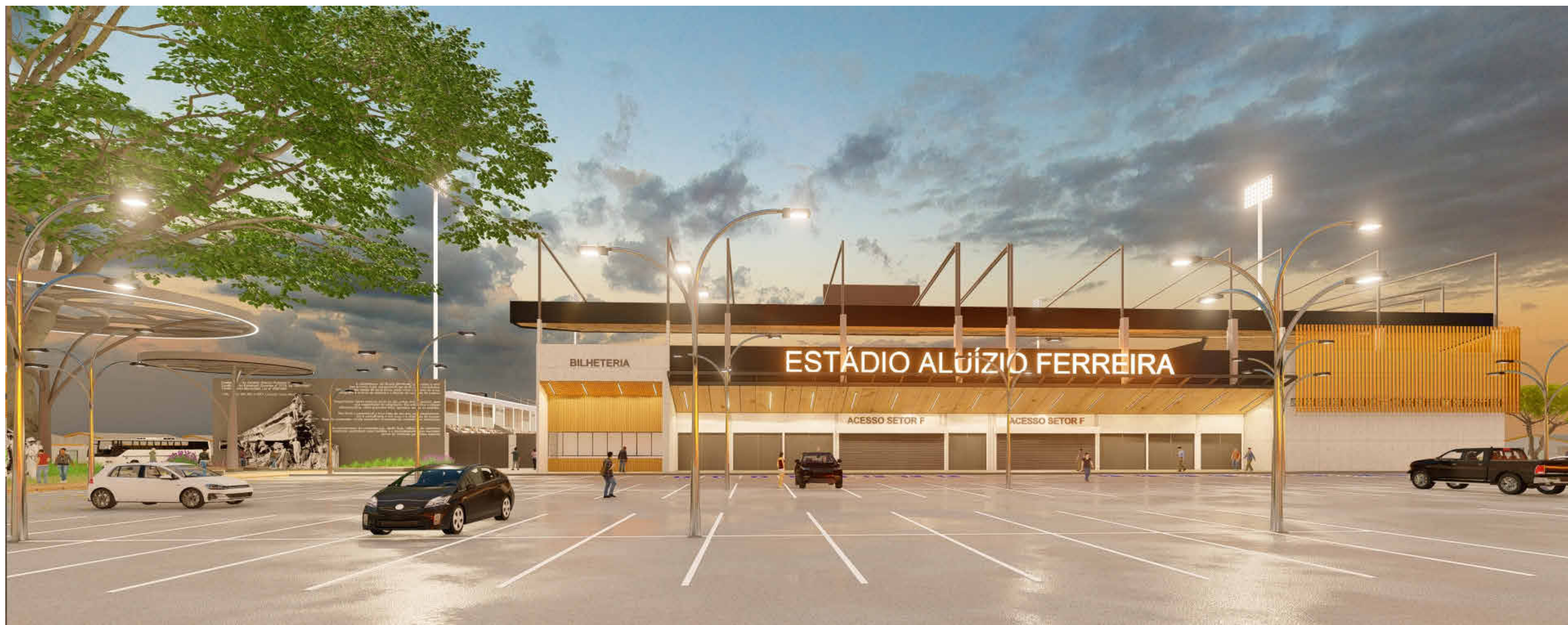
IMAGEM 2 - ACESSO SETOR F